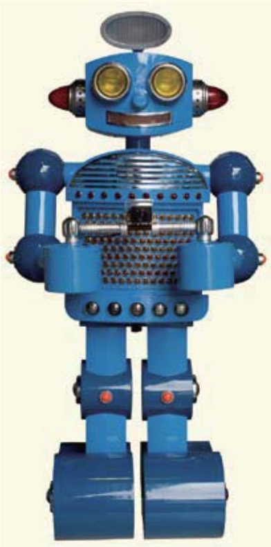
相澤次郎《カメラマンロボット「太郎」君》 財団法人日本児童文化研究所