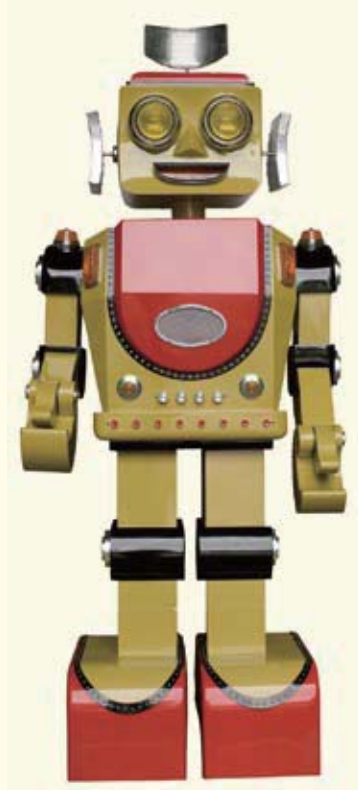
相澤次郎《モデルロボット「五郎」君》 財団法人日本児童文化研究所